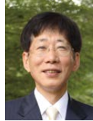
細川 涼一 京都橋大学 学長

京都には有名なスポットが多数ありますが、実はガイドブックには載らない名所も多数あります。そこで今回は、関東ではあまり紹介されない洛東地域にスポットをあてた歴史講座を開講します。聞けばあなたも京都通!