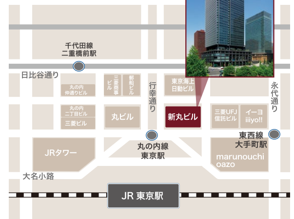
■ 京都アカデミアフォーラム in 丸の内 新丸の内ビルディング10F

京都外国語大学、京都光華女子大学、京都工芸繊維大学、京都市立芸術大学、京都女子大学、京都精華大学、京都橘大学、京都美術工芸大学、同志社女子大学、京都大学が連携し、京都の文化・芸術・科学について「学術面から情報発信する場」として広く一般に認知されることを目指し、京都の魅力や価値を高めることを目的とした場の総称です。