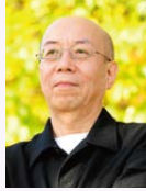
鷺田 清一 京都市立芸術大学 理事長・学長

京都は、千年を超える歴史の中で、多くの人が暮らし、その傍らには常に芸術が息づいてきました。文化を育み芸術が生まれくる京都とはどのような都市なのか考えます。