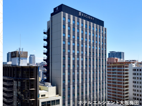
ホテルエルシエント大阪梅田