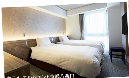
ホテル エルシエント京都八条口