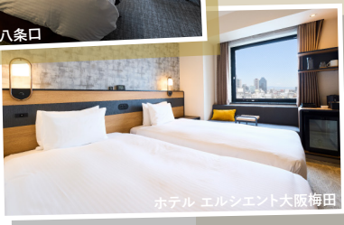
ホテル エルシエント大阪梅田