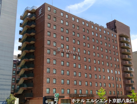
ホテルエルシエント京都八条口